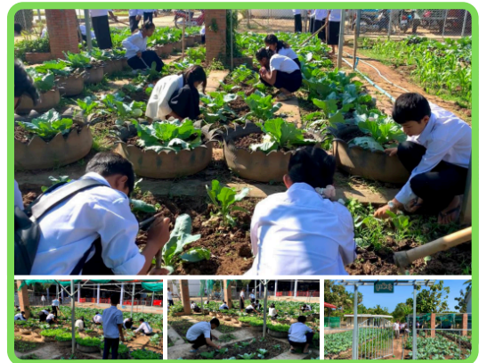
សកម្មភាពសិស្សថែរ ដំណាំនៅក្នុងសួនបំណិនជីវិត