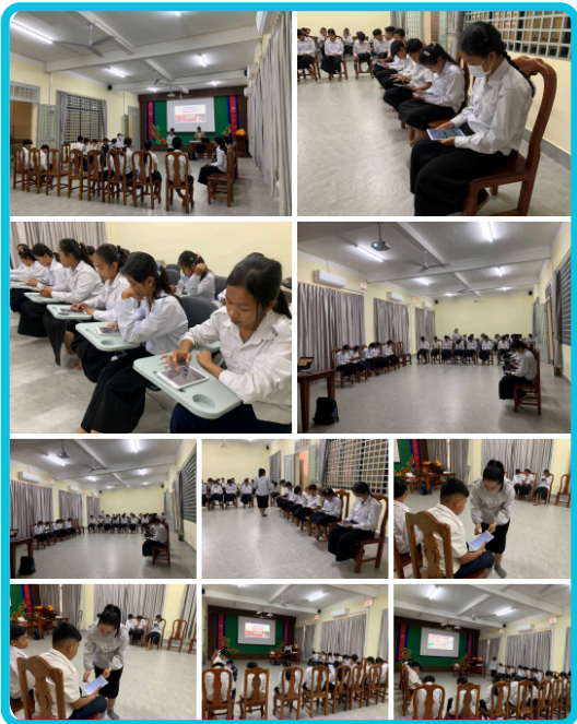
ការធ្វើតេស្តស៊ីដម្រៅដើម្បីវាស់ វែងការគិតរបស់សិស្សថ្នាក់ទី៧