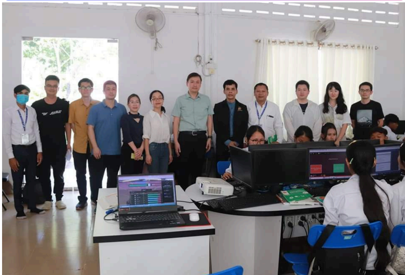
ថ្ងៃព្រហស្បតិ៍ ១កើត ខែបុស្ស ឆ្នាំថោះ បញ្ចស័ក ព.ស ២៥៦៧ ត្រូវនឹង ថ្ងៃទី១១ ខែមករា ឆ្នាំ២០២៤ វិទ្យាល័យ ហ៊ុន សែន ពាមជីកង ជំនាន់ថ្មី បានទទួលការអញ្ជើញមកទស្សនកិច្ចរបស់ប្រតិភូចិនតាមរយៈនាយកដ្ឋានបច្ចេកវិទ្យាព័ត៌មាន នៃក្រសួងអប់រំ យុវជន និងកីឡា ដើម្បីពិនិត្យមើលការបង្រៀននិងរៀនមុខវិជ្ជាកុំព្យូទ័រ(ICT)