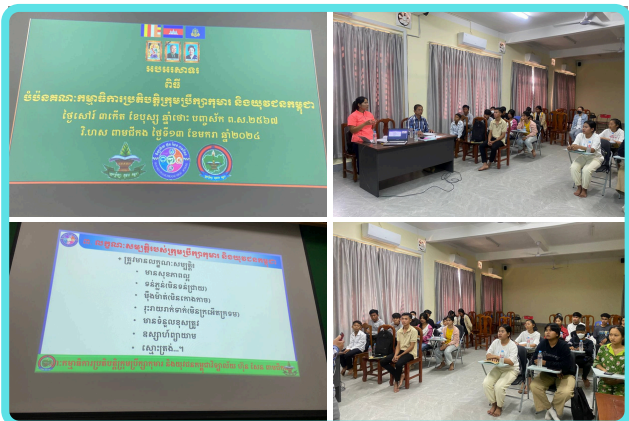
សកម្មភាពបំប៉នក្រុមប្រឹក្សាកុមារ និងយុវជន