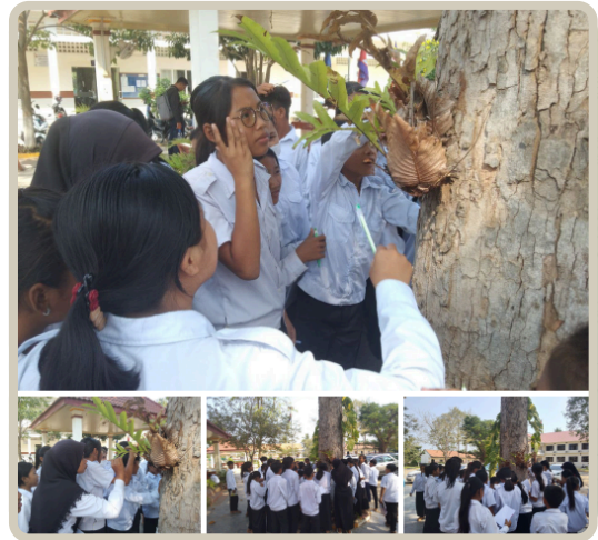
សកម្មភាពសិស្សថ្នាក់ទី7C1 ស្រាវជ្រាវពីរុក្ខជាតិបំប្រក