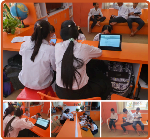
សកម្មភាពសិស្សប្រើប្រាស់ Tablet ក្នុងបណ្ណាល័យ