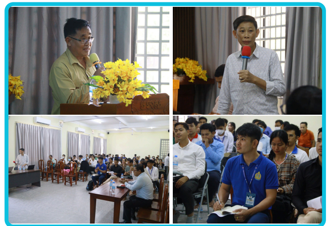
សកម្មភាពប្រជុំប្រចាំខែមករា