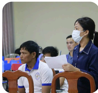
សកម្មភាពសួរ សំណួរមួយចំនួន